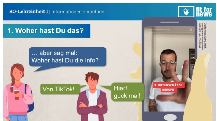
Die Powerpoint-Präsentationen dienen als roter Faden für den Unterricht. Sie zeigen Beispiele aus der Alltagswelt der Jugendlichen, hier Influencer auf TikTok.

Das Lehrpaket ist modular gestaltet, so dass jede Einheit für sich wie auch in Kombinationen genutzt werden kann. Die Einheiten können im Unterricht, unterrichtsbegleitend oder auch außerschulisch für Veranstaltungen genutzt werden. Der zeitliche Umfang je Einheit beträgt – je nachdem, wie viele Übungselemente die Lehrperson einbaut –, ca. 15 bis 35 Minuten. Genaueres dazu steht in den Manuals.